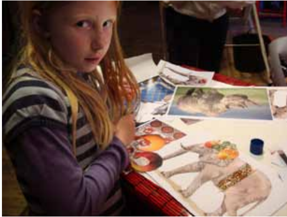
Barnen klipper och klistrar djur och frukter på Skansen, Stockholm.